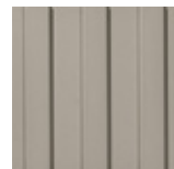
GUIDE LINE CI 20x20x1.2 cm LG20 | K34