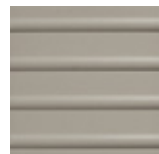
CAUTION LINE CI 20x20x1.2 cm LC20 | K34